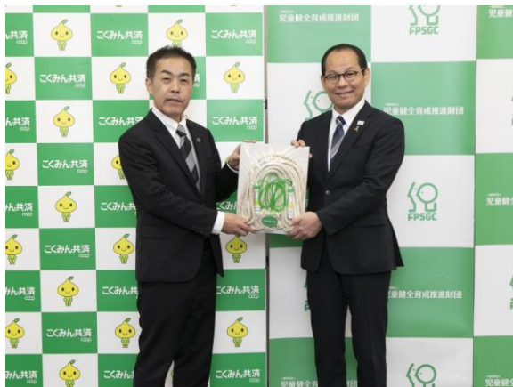
なわとび・長なわ寄贈の様子

今後も、未来を担う子どもたちが心身ともにすこやかに成長できる社会を願い、取り組みをすすめてまいります。