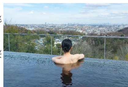
貸出画像「絶景露天風呂」