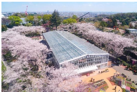
貸出画像「HANA・BIYORIの桜(昨年の様子)」