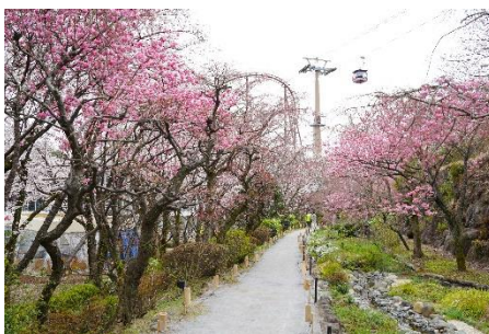
貸出画像「多摩緋桜が咲く散策路(過去の様子)」

1980年頃、ソメイヨシノに代わる「よみうりランドの名物」となるオリジナルの桜を作出したいという思いから生まれた桜です。ソメイヨシノと比べ、色が濃く鮮やかで、開花時期が早く見ごろの期間も長いのが特徴です。