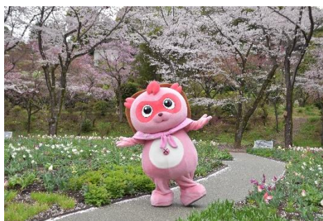
貸出画像「ピンぽん(昨年の様子)」