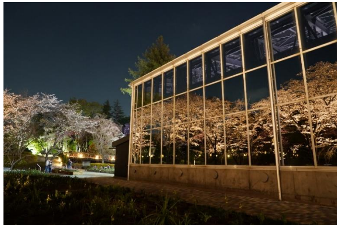
貸出画像「夜桜びより(昨年の様子)」

※園内には缶・ビン類、アルコールのお持込みはできません。お弁当のお持込みは可能です