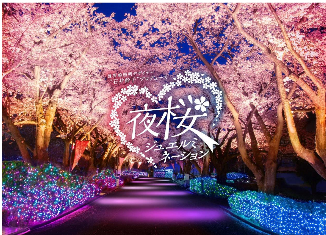
貸出画像「夜桜ジュエルミネーション」

また、遊園地に隣接する新感覚フラワーパーク「HANA・BIYORI」は同期間中に、「夜桜びより」を開催します。3月6日(水)に園内にオープンする「よみうりランド眺望温泉 花景の湯」で絶景露天風呂や岩盤浴を楽しんだあと、HANA・BIYORI館を囲む桜の幻想的なライトアップで極上の癒やしが味わえます。