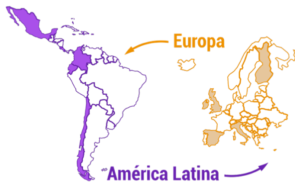
Figura 1. Países involucrados en el proyecto